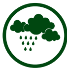
Eau de pluie

GRUPE HYDROPHORE AVEC REGULATEUR DE FREQUENCE POUR LA RECUPERATION D'EAU DE PLUIE DOMESTIQUE