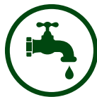
Eviers et robinets